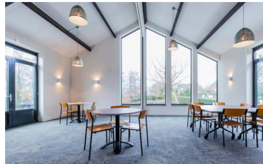
Huis voor Iedereen