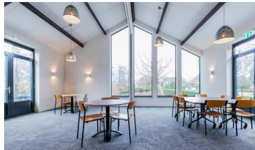
Huis voor Iedereen